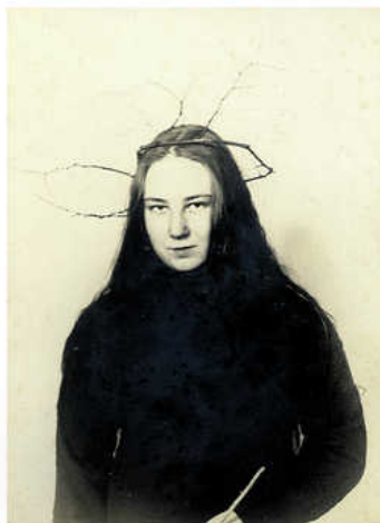
Mona Lisa-achtige vrouw met zelfgemaakt 'gewei'.