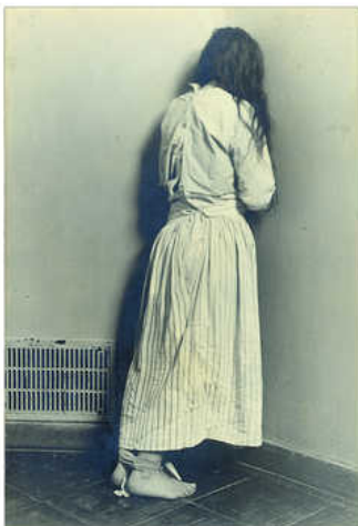
Savill, Myopathie Primitive , 1894. Museum Dr. Guislain

Ze zal niet meer leven. Haar gezicht doet dat wel, levensgroot en in dramatisch zwart-wit, in het boek Das Gesicht des seelisch Kranken uit 1967. Ergens in het midden van de tentoonstelling Lichtgevoelig in het Museum Dr. Guislain in Gent is de foto van deze vrouw het keerpunt. Grijpt zij je pols en laat niet meer los. Alles wat ik daarvoor heb gezien wordt gekleurd - en alles erna ook.